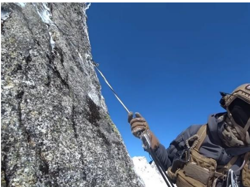
核心部の背びれ岩のハーケンの状況