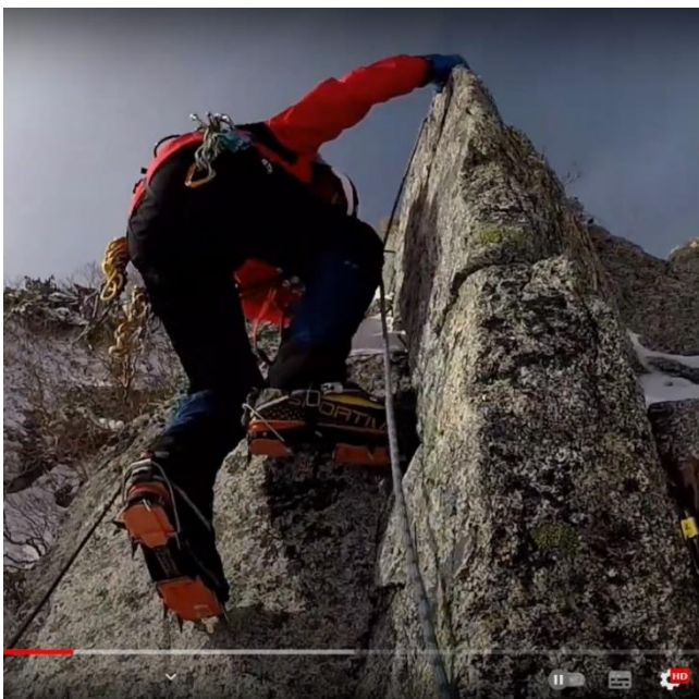
背びれ岩の中の凹角に足を置き、右手で背びれ岩の背の部分を掴みながら登攀する