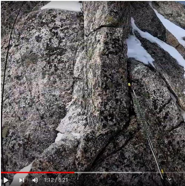
背びれ岩の右クラックにカム設置してにスリングを掛ける