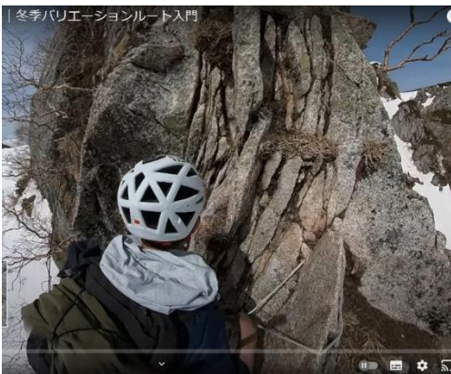
途中の岩に中間支点 (カム設置)