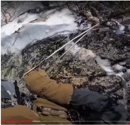
途中の左側のハイマツに中間支点

始めワイヤーの右側、露出している岩稜を登る、背びれのような一枚岩の乗越が核心 背びれの左側