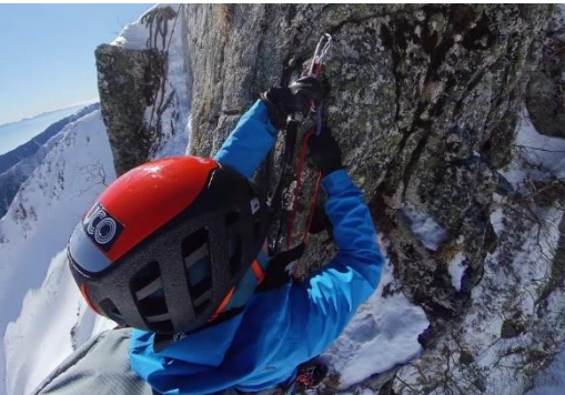
核心部の滑り岩のハーケンに中間支点とる