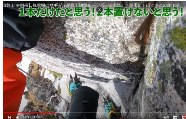
背びれ岩の窪みにハーケンあるので中間支点取る