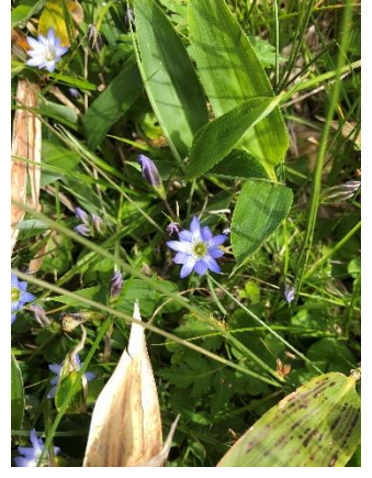
タテヤマリンドウ