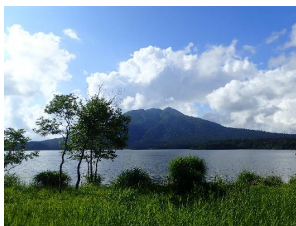
尾瀬沼から「燧ヶ岳」