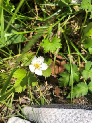
シロバナヘビイチゴ