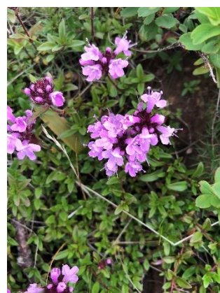
イブキジャコウソウ